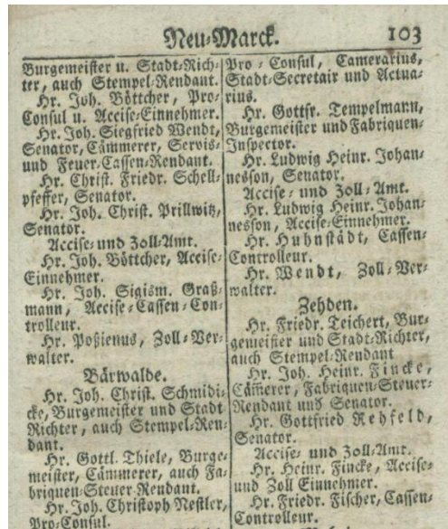
Abb. 2: Ausschnitt aus dem Adres-Calender, 1775

Erschienen: 1748, 1752, 1756, 1767, 1770, 1775