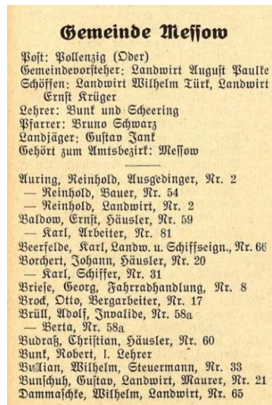
Abb. 1: Ausschnitt aus dem Einwohnerbuch von Stadt und Kreis Crossen, Ausgabe 1926

Adressbücher können über die Zeitschriftendatenbank ermittelt werden: https://zdb-katalog.de